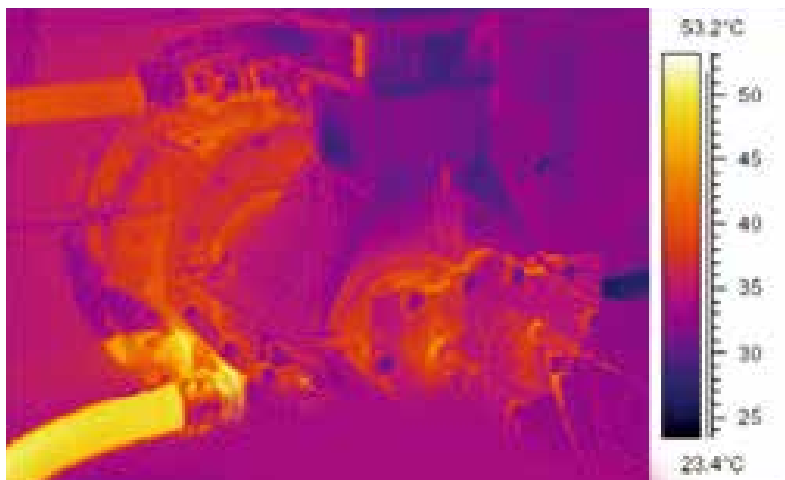
压缩机主机温度升高有限，仅 25°C